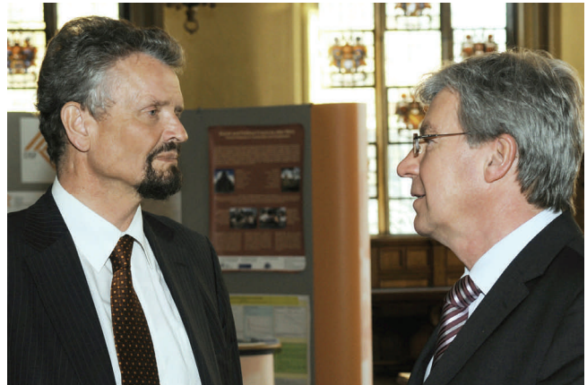
Der Bremer Oberbürgermeister Jens Böhrnsen (rechts) begrüßte Staatsminister Gernot Eler im Bremer Rathaus