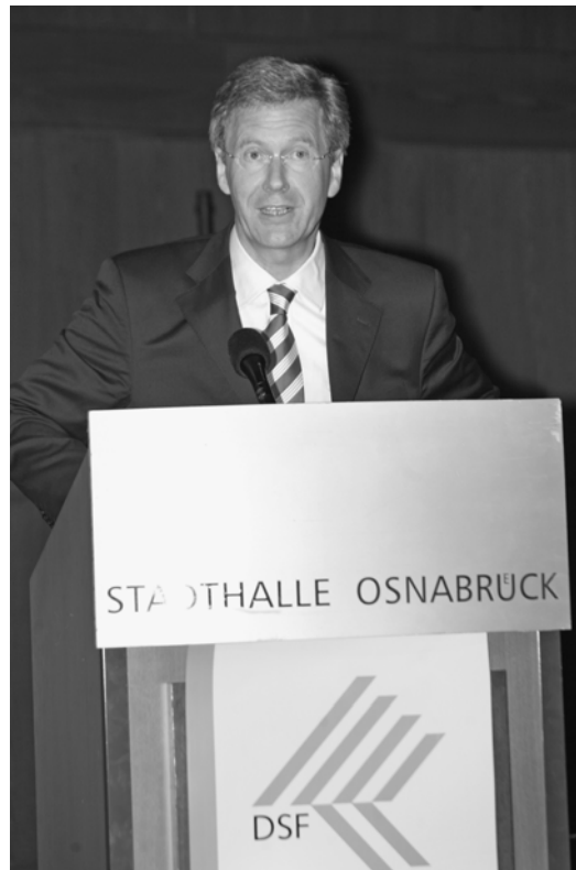
Christian Wulff, Ministerpräsident des Landes Niedersachsen

Wichtig erscheint mir an dieser Stelle der Hinweis, dass die DSF als Stiftung gegründet wurde. Der Stiftungsgedanke garantiert die Erfüllung des Stiftungszwecks unabhängig von externen Einflüssen. Der Stifter als Finanzier bleibt Herr im eigenen Haus. Seit einigen Jahren gibt es deshalb einen starken Trend, neue Stiftungen zu gründen, seien es staatliche oder private.