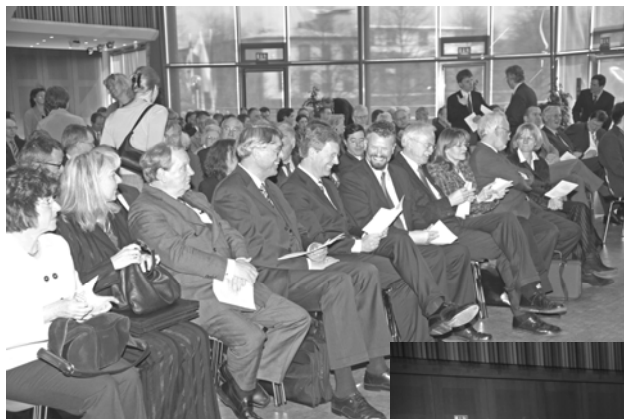
Gäste aus Stadt, Land und Bund waren der Einladung der DSF in die Stadthalle Osnabrück gefolgt

Außerdem möchte ich hier unterstreichen, dass wir an den Ergebnissen der Forschungsaktivitäten der Deutschen Stiftung Friedensforschung großes Interesse haben, nicht zuletzt um Schlussfolgerungen für unsere Integrationspolitik in Niedersachsen und Deutschland ziehen zu können. Wir benötigen dringend mehr Aufklärung über die religiösen Grundlagen anderer Kulturen, damit wir in der Lage sind, unser Zusammenleben angemessen zu gestalten. 3,5 Millionen Menschen muslimischen Glaubens leben in Deutschland, darunter sind 750.000 Jugendliche in Schulen und Ausbildungseinrichtungen, die ein Recht auf ihre Chancen haben.