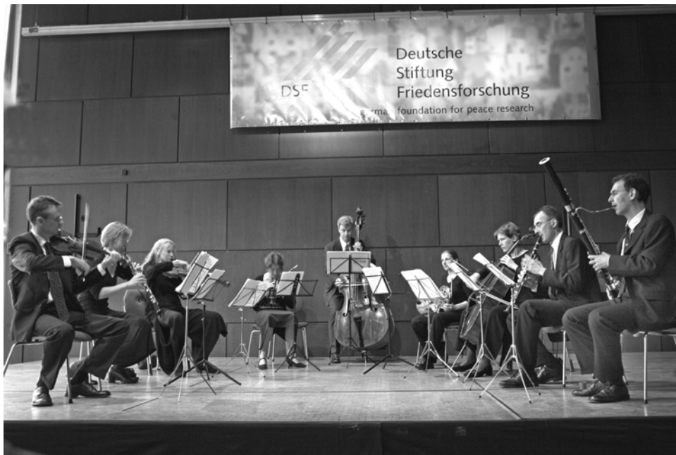
Mitglieder des Osnabrücker Symphonieorchesters umrahmten die Festveranstaltung

Zum Schluss möchte ich allen Beteiligten noch einmal meinen herzlichen Dank aussprechen. Hierbei schließe ich die Stadt Osnabrück und das Land Niedersachsen ein. Ich habe die Ankündigungen von Ministerpräsident Wulff mit Interesse und Freude zur Kenntnis genommen. Wir haben mit der Stiftung, wenn ich das so sagen darf, ein gemeinsames Kind, dessen weitere Entwicklung wir unterstützen sollten, nicht zuletzt im Hinblick auf das Interesse der Politik an kompetenter Beratung. In diesem Sinne wünsche ich der Stiftung Glückauf für die nächsten fünf Jahre und viel Erfolg bei der Verwirklichung der ambitionierten Ziele.