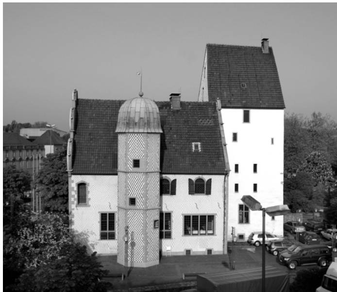
Steinwerk Ledenhof Sitz der DSF in der Friedensstadt Osnabrück

Es ist dem Thema wie auch dem Anspruch der Stiftung angemessen, dass die Stadt Osnabrück der Stiftung einen Adelssitz zur Verfügung stellte, um hier ihre Geschäftsstelle einzurichten. Er liegt zudem gegenüber dem Schloss, das von der Universität Osnabrück genutzt wird. Dies unterstreicht die Bedeutung des Themas Frieden, dem die Bundesstiftung Friedensforschung ihre Aktivitäten widmet, und die Bedeutung desselben für die Außendarstellung für die Stadt Osnabrück. Die Stadt wird auch weiterhin den Geschäftsführenden Vorstand, den Stiftungsrat und die Geschäftsführung mit allen zur Verfügung stehenden Mitteln unterstützen. Dies liegt im Sinn und Anspruch der Friedensstadt Osnabrück.