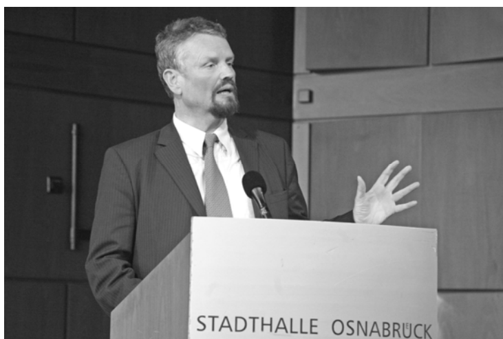
Gernot Erlen, Staatsminister im Auswärtigen Amt

Hierdurch ist eine neue Normalität entstanden, die viele vor nicht allzu langer Zeit für nicht möglich gehalten hätten. Denn es ist erst sieben Jahre her, dass Europa angesichts von vier aufeinander folgenden Balkankriegen, die die Europäische Union nicht hatte verhindern können, an einem politischen Tiefpunkt angekommen und von demonstrativer Hilflosigkeit gekennzeichnet war. Es ist erst dreieinhalb Jahre her, dass die Europäische Union zum ersten Mal zivile und militärische Friedensoperationen durchführte. Und es ist erst zweieinhalb Jahre her, dass die EU eine gemeinsame Sicherheitsstrategie beschlossen hat, die einen konzeptionellen Rahmen für diese Aktivitäten bildet. Heute ist die EU aus den internationalen Friedensbemühungen nicht mehr wegzudenken, auch wenn angesichts der Probleme mit der europäischen Verfassung niemand die globale Rolle der EU überschätzen wird. Gleichwohl wurden in sehr kurzer Zeit Fähigkeiten entwickelt und Kapazitäten aufgebaut, die heute auf eine wachsende Nachfrage stoßen. Dies spiegelt sich auch in den 16 Missionen wider, die in vergleichsweise kurzer Zeit stattgefunden haben. Diese Nachfrage ist positiv für das Ansehen und das Prestige der EU, insbesondere im Zusammenhang mit der eigenen krisenhaften Entwicklung im Rahmen der Verfassungsdiskussion. Aber die Frage lautet: Worauf richtet sich eigentlich diese Nachfrage und was sind die Leistungen, die erwartet werden?