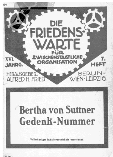
Ausgabe August/September 1914