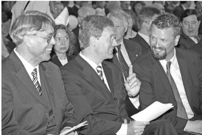
Fünf Jahre DSF – Gelegenheit zum Gespräch

Dies führt mich zur Frage der finanziellen Ressourcen. Dieses Problem betrifft nicht nur die Deutsche Stiftung Friedensforschung. Die Wissenschaft ist grundsätzlich unersättlich, wenn es darum geht, die Forschung voranzutreiben. Da sollte sich Herr Ministerpräsident Wulff auch keine Illusionen machen. Denn die Unersättlichkeit besteht nur vordergründig in der Forderung nach mehr Geld. Der Antrieb der Wissenschaft kommt aus dem Streben nach neuen Erkenntnissen, nicht nur mit dem Ziel eines abstrakten Fortschritts, sondern auch im Hinblick auf die Gewinnung relevanter Ergebnisse. Aus diesem Grund wird die Politik den Forderungen der Wissenschaft immer nur zum Teil nachkommen können. Ich hoffe aber, dass wir in den nächsten Jahren in der Lage sein werden, dem Unersättlichkeitstrieb zumindest ein Stück weit entgegen kommen zu können. Leider gibt es im Augenblick keine Salzgitter AG, die zum Verkauf ansteht. Aber vielleicht findet sich etwas Vergleichbares.